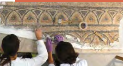
Materials arqueològics i paleontològics