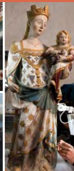
Escultura i pintura sobre pedra