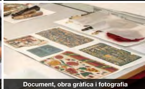
Document, obra gràfica i fotografia