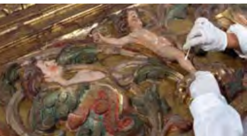
Escultura i pintura sobre fusta