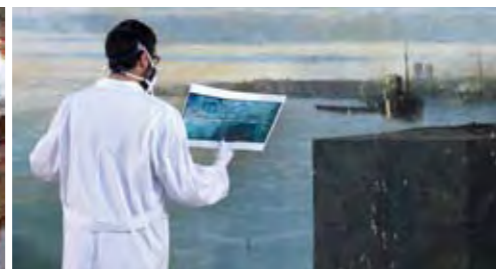
Pintura sobre tela