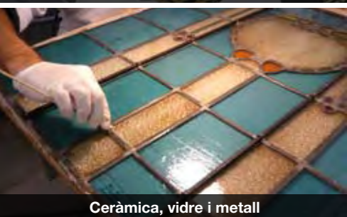
Ceràmica, vidre i metall