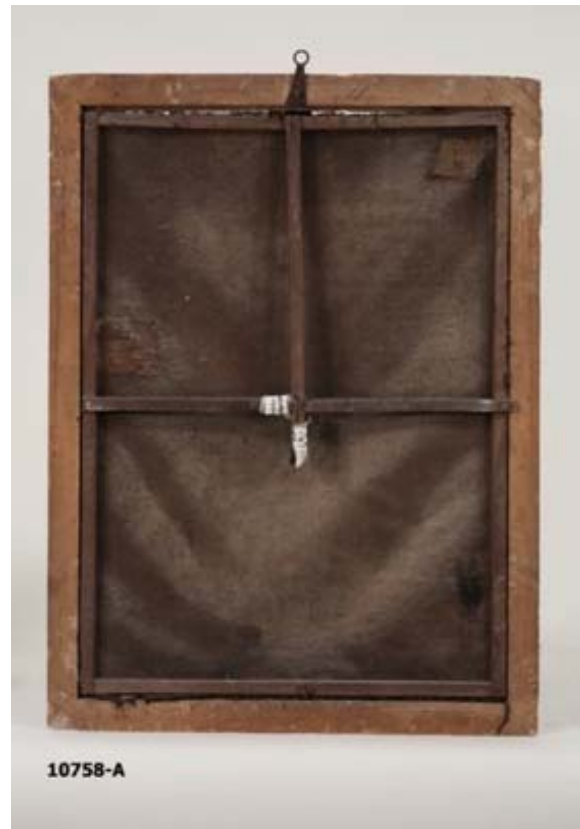
Fotografies d'inici de l'anvers i el revers