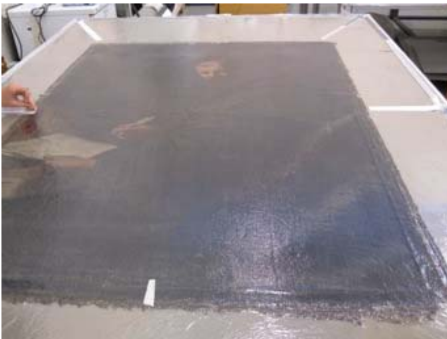
Procés de minimització de les deformacions a la taula calenta de succió