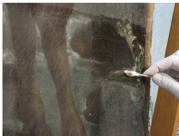
Durant el procés de neteja