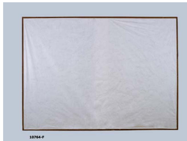
Revers del quadre protegit amb Tyvek®