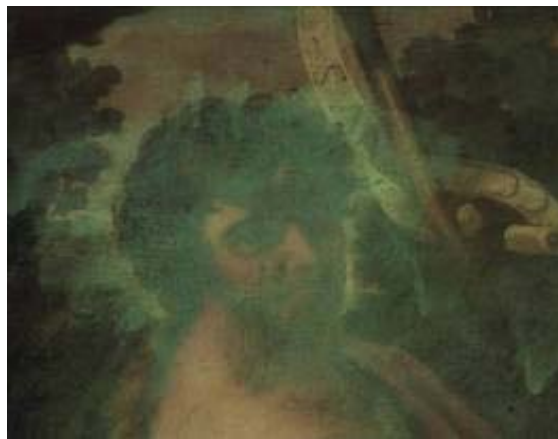
Examen amb llum UV. Detall abans de la intervenció.