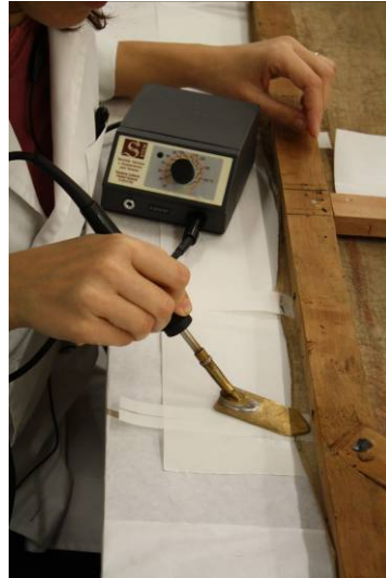
Procés de consolidació de la zona perimètrica del suport de tela