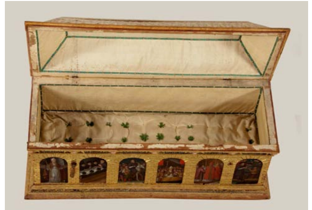
Fotografies abans i després de la restauració