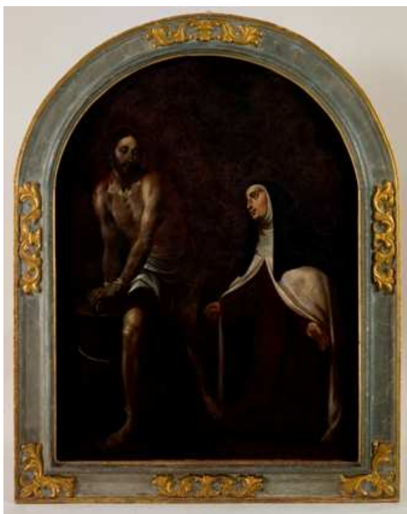
Aparició de Crist a santa Teresa