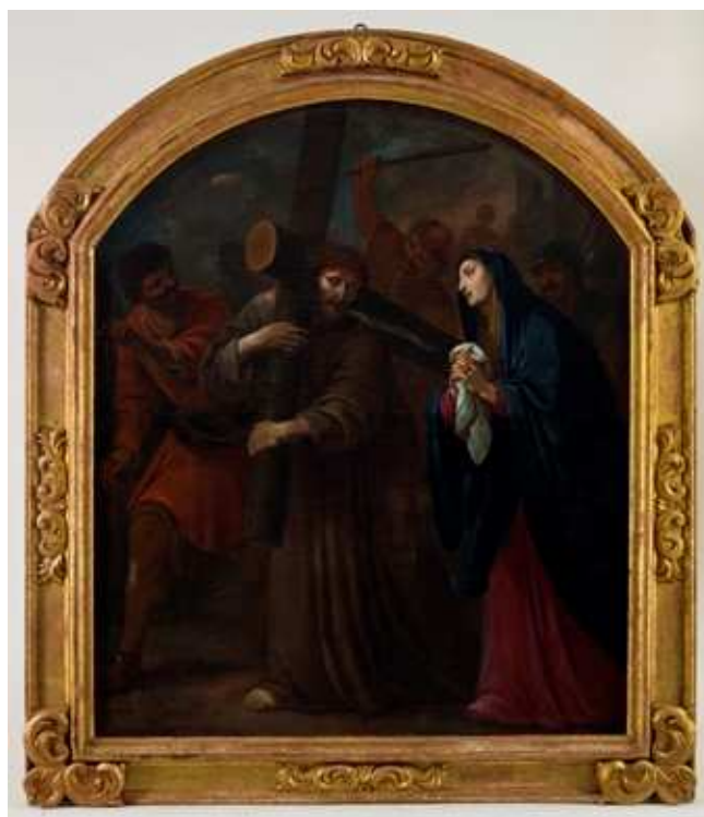
Jesús troba la seva mare

El Centre de Restauració de Béns Mobles (CRBMC) del Departament de Cultura ha confirmat que Antoni Viladomat i Manalt, un dels pintors més rellevants del període barroc, és l'autor de dues pintures que són propietat del convent de les Carmelites Descalces de Lleida. Concretament es tracta de dues obres sobre tela, de gran format, i de temàtica religiosa. Una d'elles representa la quarta estació del viacrucis, Jesús troba la seva mare , i l'altra, L'aparició de Crist a santa Teresa .