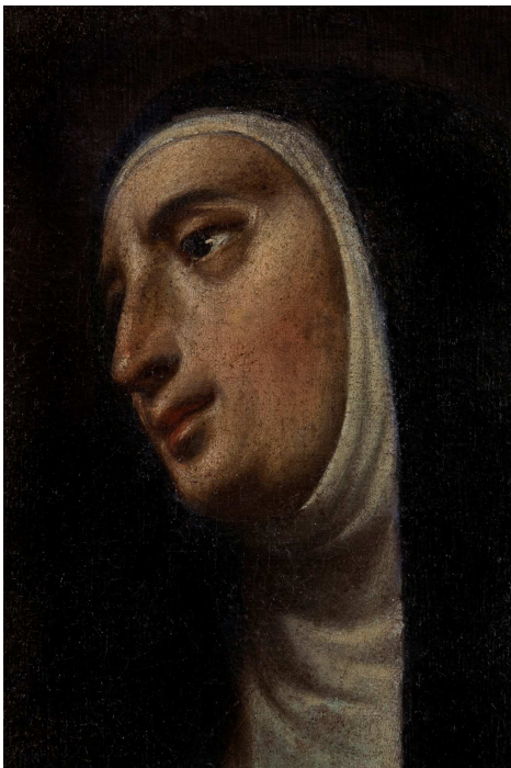
Detall de l'Aparició

L'estat de conservació de les pintures era deficient. Els detalls de les escenes no s'apreciaven a causa de l'envelliment propi dels materials de l'obra i dels materials afegits en antigues restauracions.