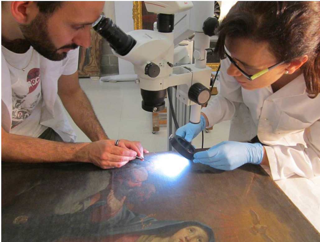
Presa de mostres amb el tècnic del laboratori