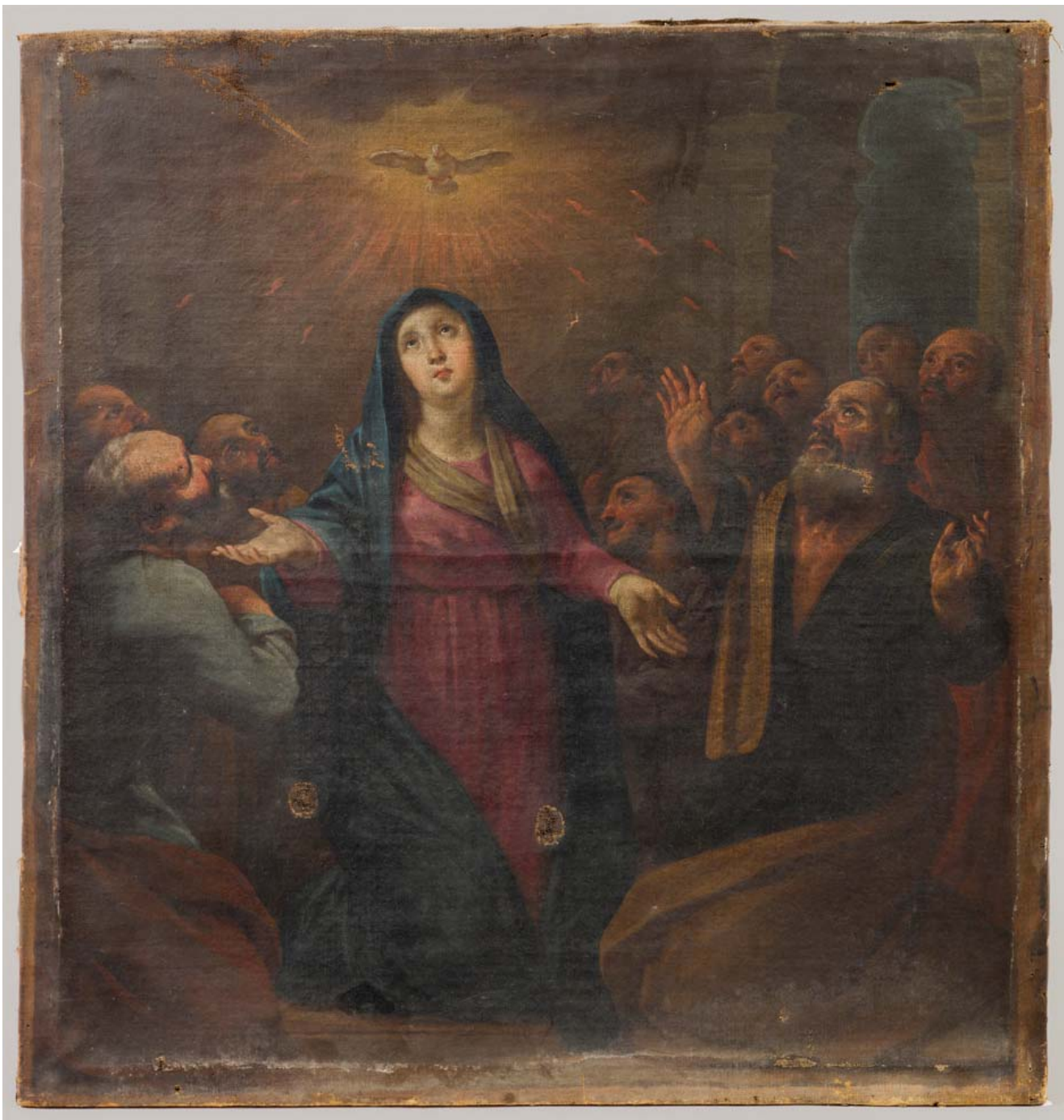
Imatge general abans de la intervenció