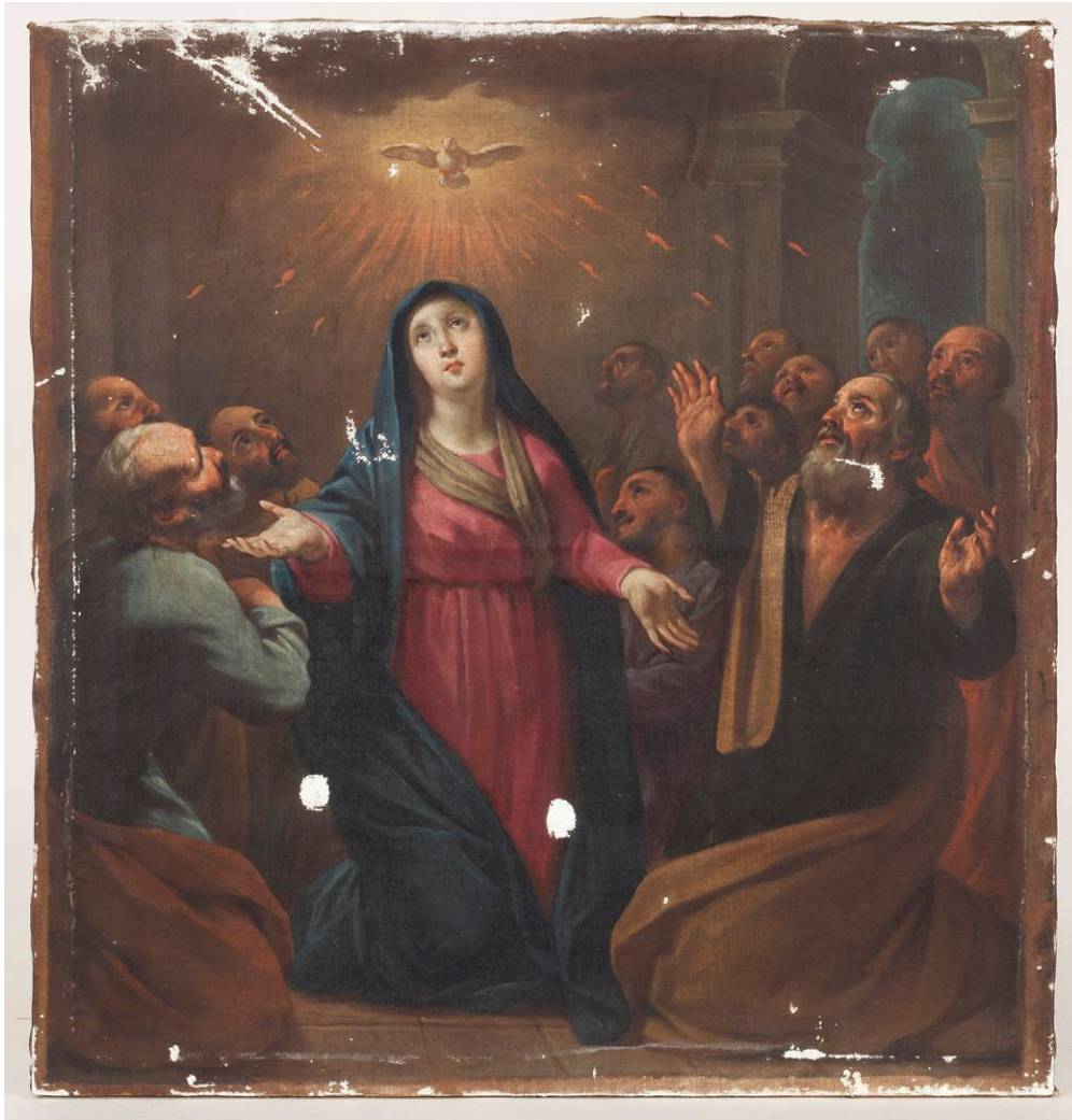
Imatge general amb la pintura massillada