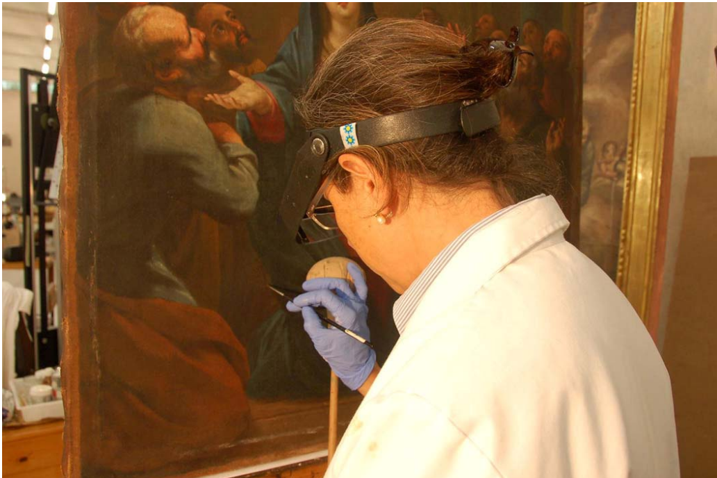
Procés de retoc pictòric de tipus il·lusionista