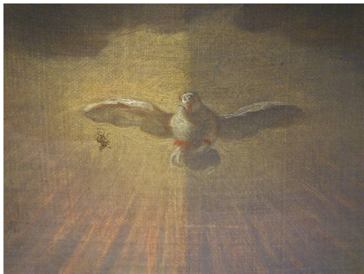
Detall del procés de neteja