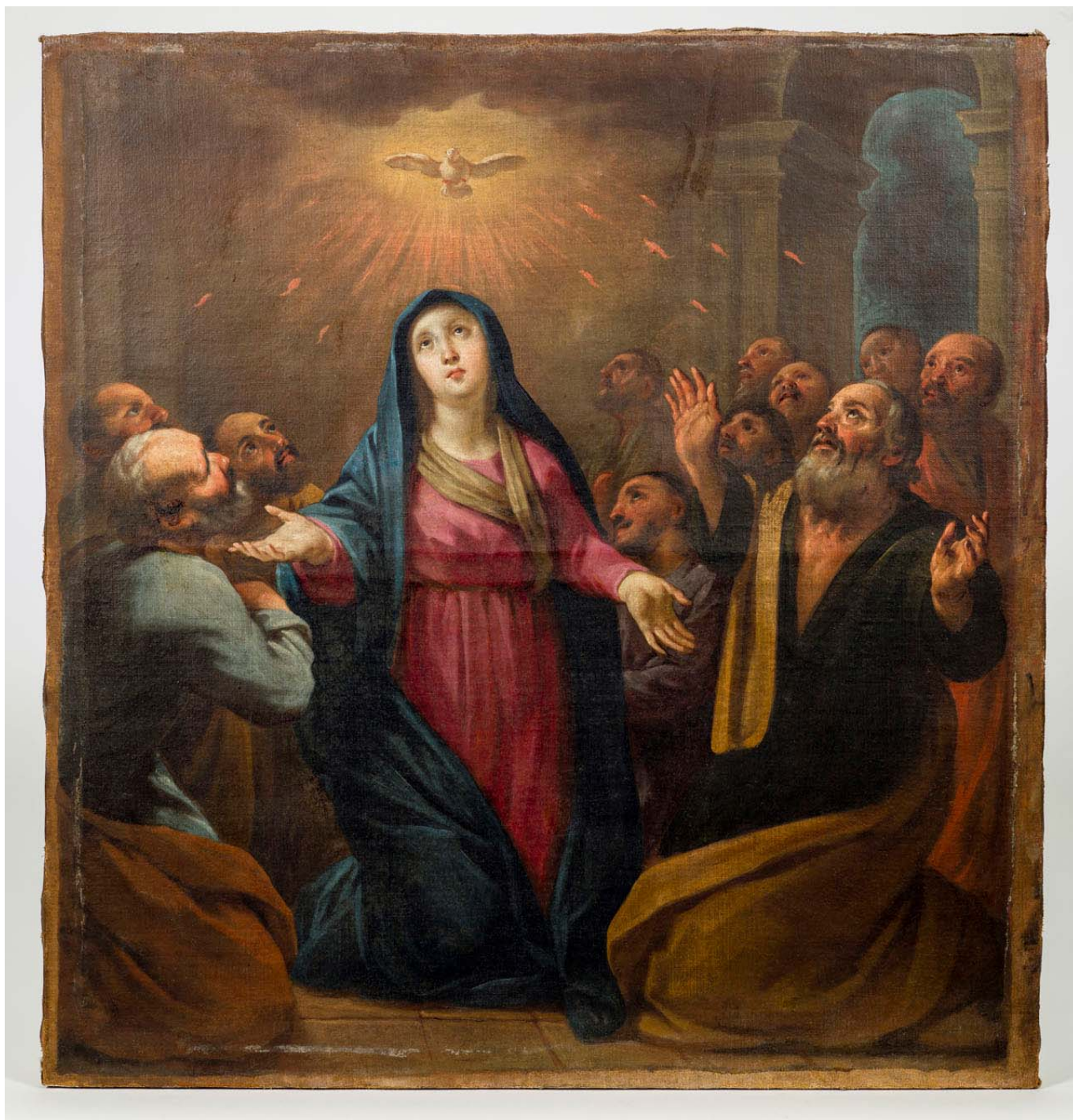
Imatge general acabada la intervenció