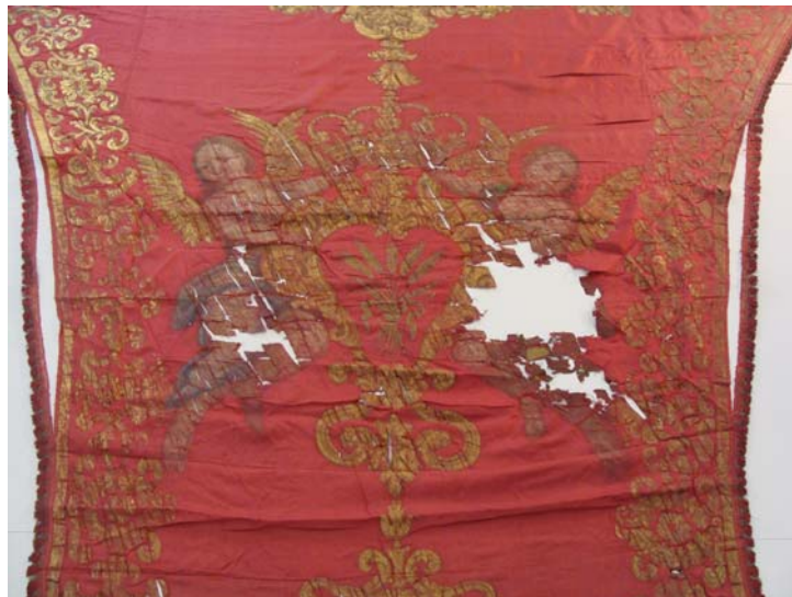
Abans de restaurar. Zona del plec un cop retirada la intervenció anterior