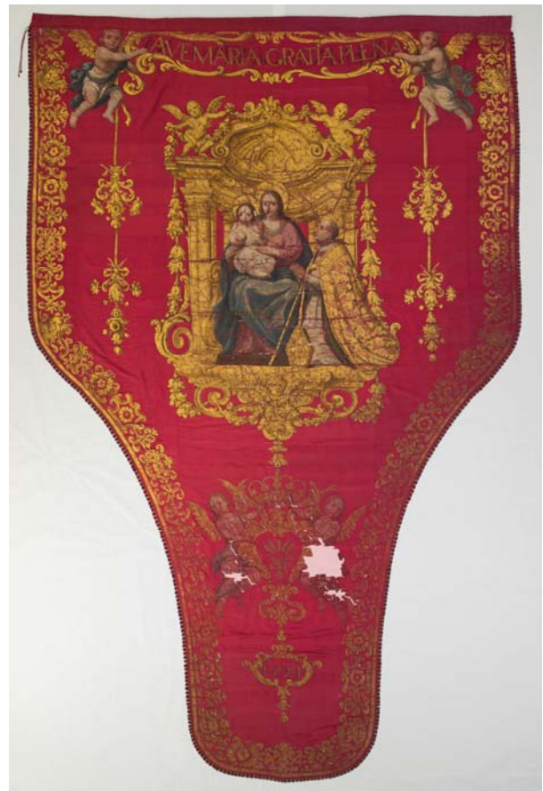
Revers després de restaurar