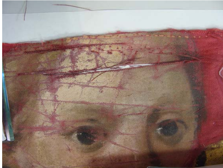
Abans de restaurar. Estrips i pèrdues