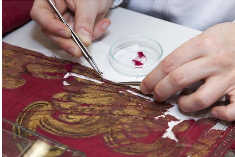
Procés de consolidació amb reintegració matèrica de la part superior