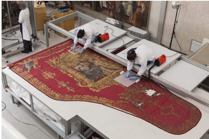
Procés d'aspiració de la brutícia superficial