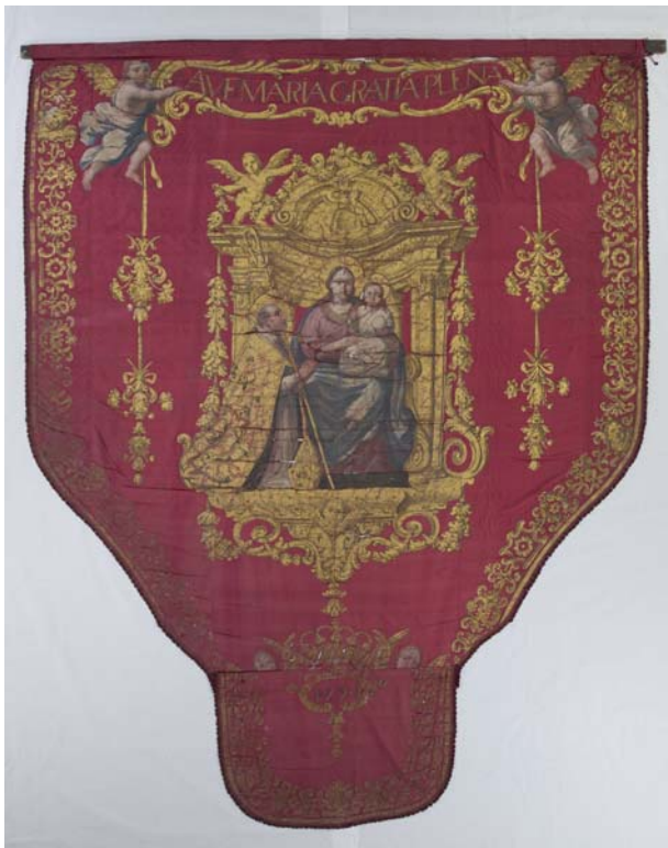
Anvers abans de restaurar