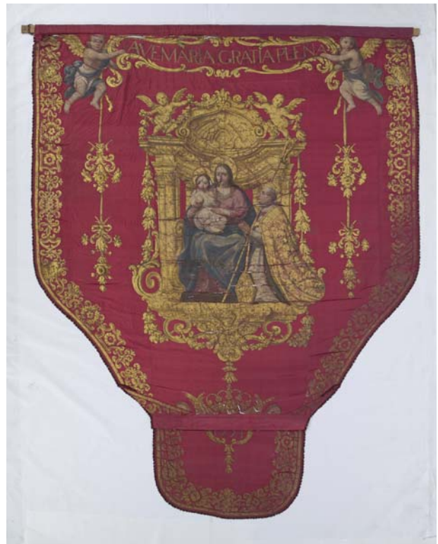
Revers abans de restaurar