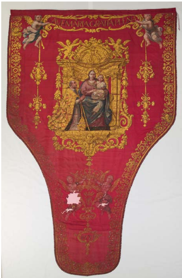
Anvers després de restaurar