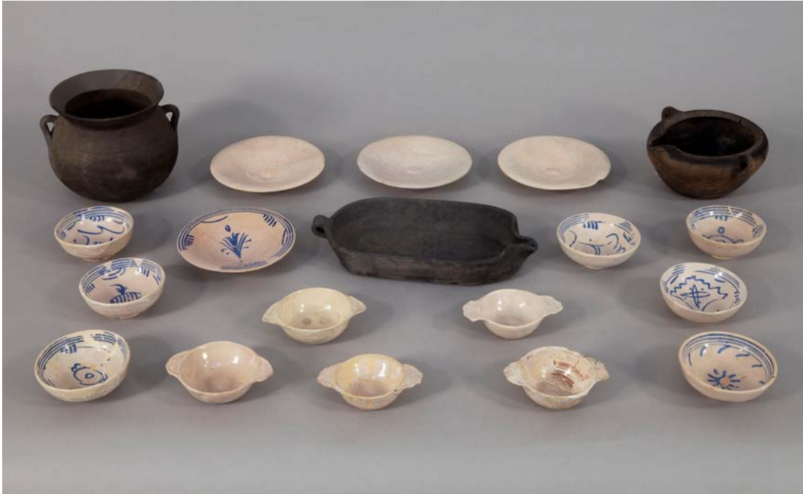
Conjunt de peces procedents del Castell de Montsoriu restaurades l'any 2011.