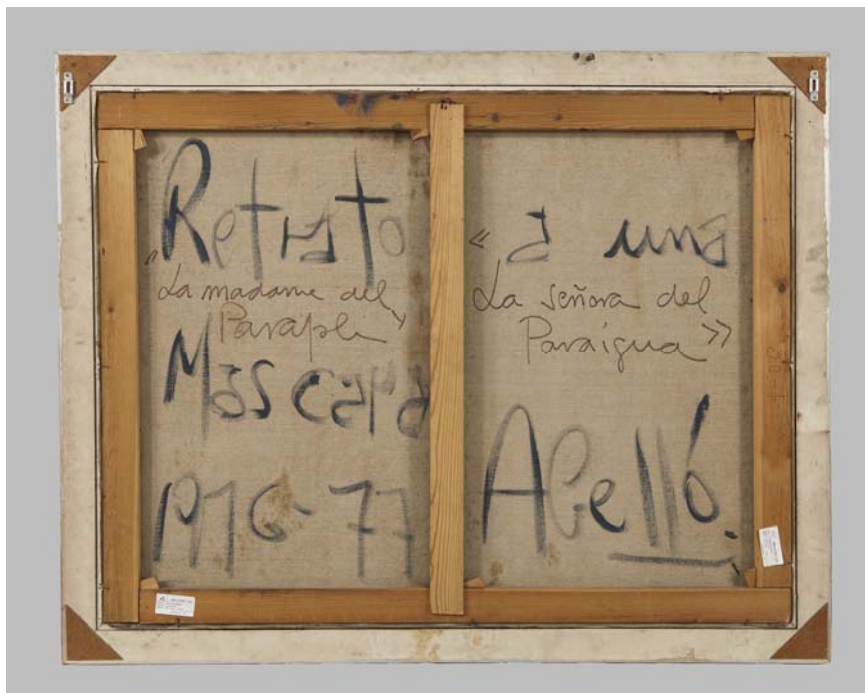
Fotografia anvers i revers abans de la intervenció