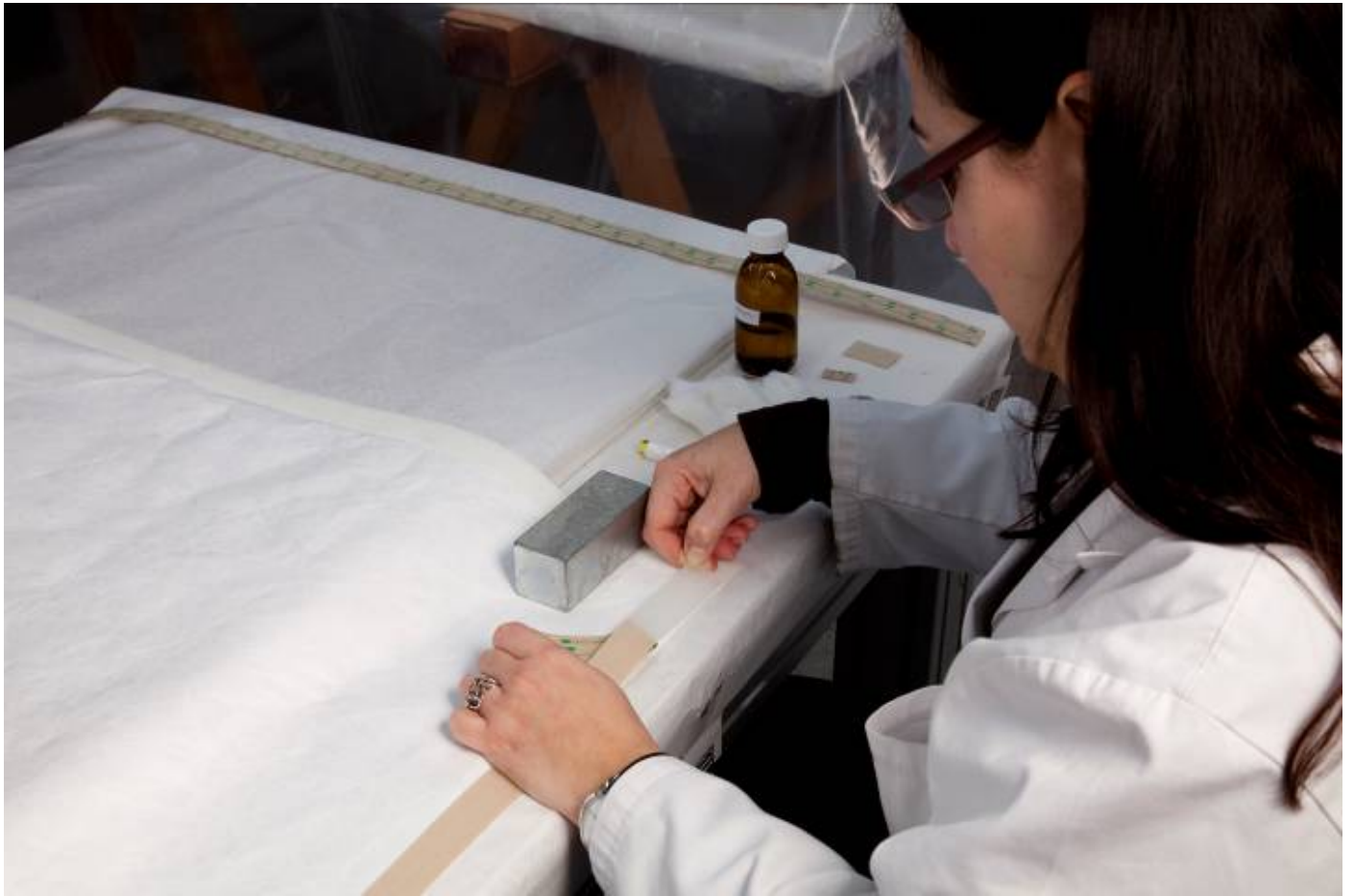
Procés: preparació de la protecció del revers