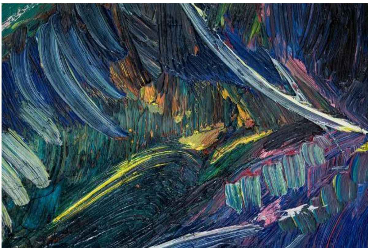
Foto de detall dels aixecaments feta amb llum rasant, abans i després de restaurar