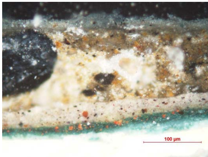
Estratigrafia. Estudi de la superposició de capes de l'obra