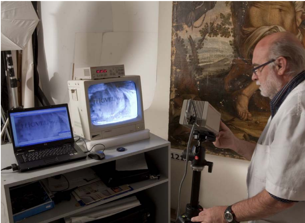
Examen de la zona de la signatura amb reflectografia d'infrarojos