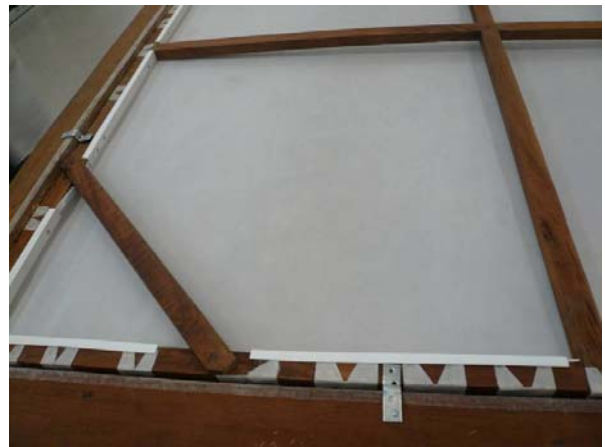
Procés de consolidació de la tela de la zona dels gavarrots i detall del revers amb la tela de reforç