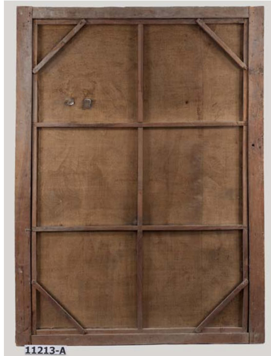
Anvers i revers abans de la intervenció