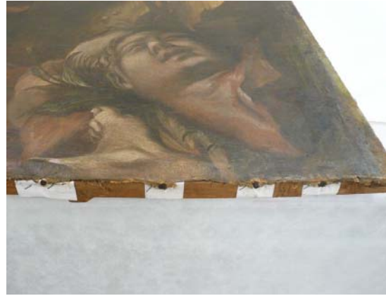
Detall de l'estat de conservació del perímetre de la tela abans i després de la consolidació