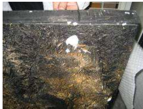
Estat de l'obra quan arriba al CRBMC. S'observen cloves d'ou despreses i l'espiral deformat en el seu extrem

Així, la intervenció ha consistit a fixar el filferro a la superfície pictòrica amb un cianocrilat i redreçar l'extrem deformat en la posició original, seguint la documentació fotogràfica anterior de l'obra. Pel que fa als brins de palla que es mouen (susceptibles de caure), es fixen amb un acetat de polivinil de pH neutre barrejat amb Tylosse® per tal d'augmentar-ne la viscositat i la reversibilitat. I els fragments de clova d'ou, s'enganxen amb cianocrilat al filferro seguint fotos anteriors.