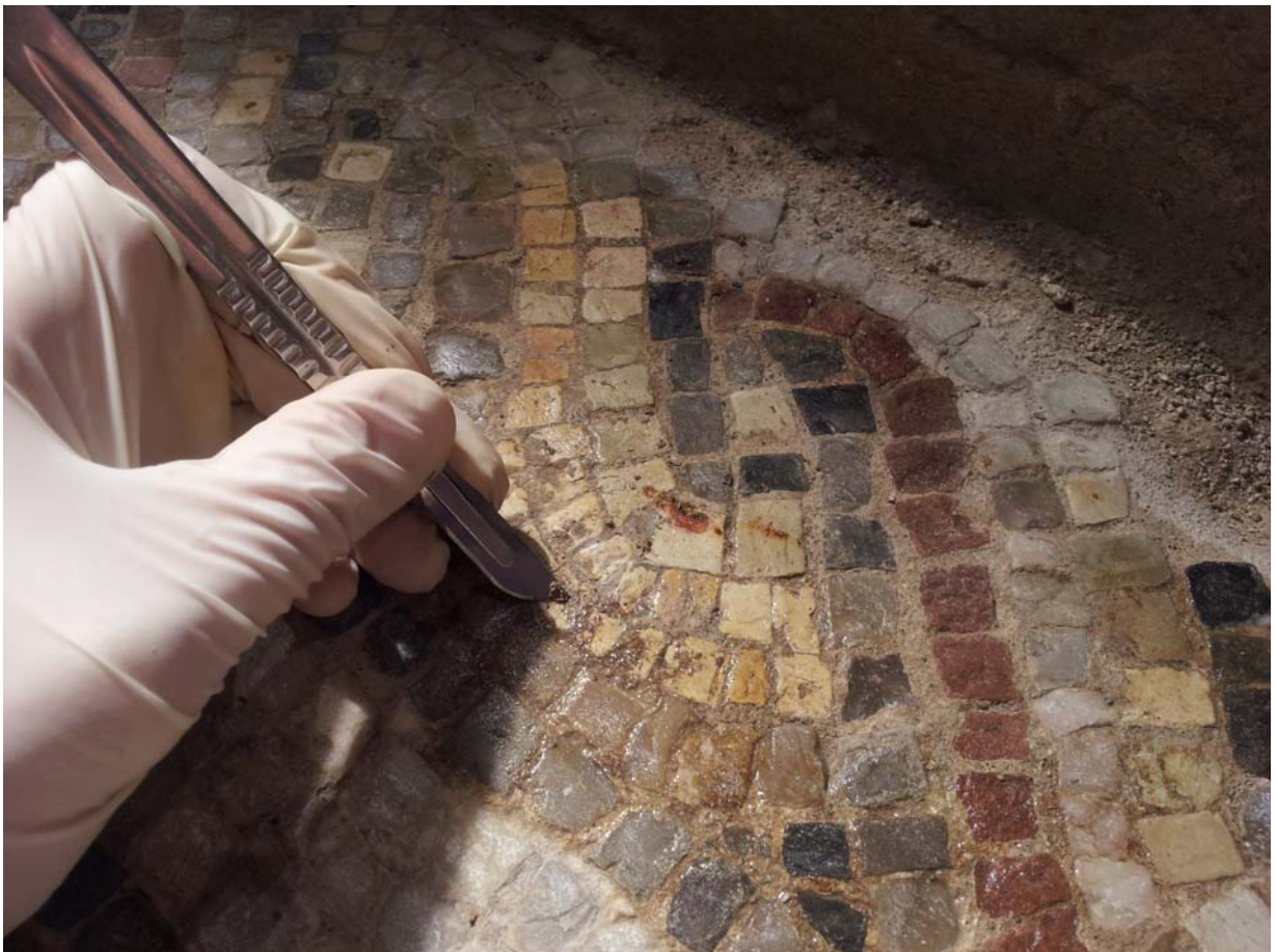
Detall del procés de neteja

Actualment la domus és visitable en horaris establerts pel Museu d'Història de la Ciutat de Barcelona.