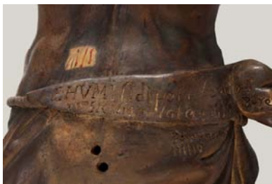
Inscripció incisa en el perizoni o tovallola

Una vegada desinfectat el conjunt, s'ha separat el crist de la creu per poder tractar el revers. En aquest procés s'ha pogut veure la inscripció incisa que presenta el perizoni, en la qual consta el nom de l'autor, així com la data d'execució de l'obra: "F. Humili di Petralia Minorese maestro siciliano lo fece 1635 8tobre 4 Palermo. S.aronino".