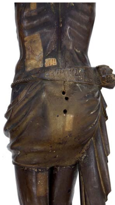
Revers de la talla amb les diverses proves fetes

D'altra banda, també s'han extret mostres per determinar, mitjançant diverses anàlisis, els materials compostius dels diversos estrats de l'escultura, i també s'ha dut a terme un profund estudi radiogràfic. S'ha sanejat el suport en aquells punts en què es trobava degradat i debilitat per l'atac dels insectes, i s'ha consolidat amb una resina per tal de recuperar certa estabilitat.