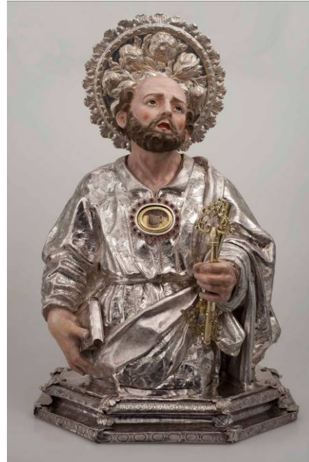
Bust reliquiari abans i després de restaurar