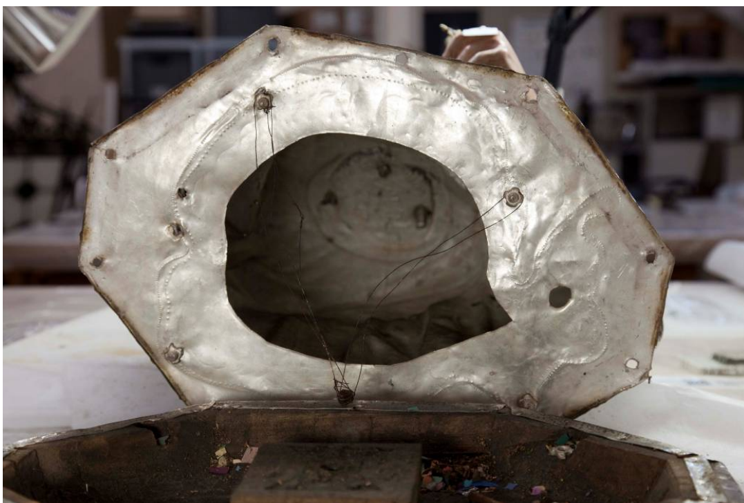
Base del bust sense la peanya de fusta