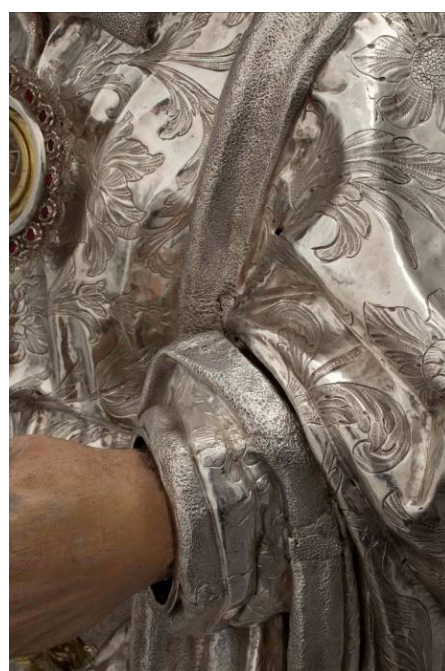
Detall, abans i després de restaurar de la màniga, una de les zones més deteriorades de tota la peça