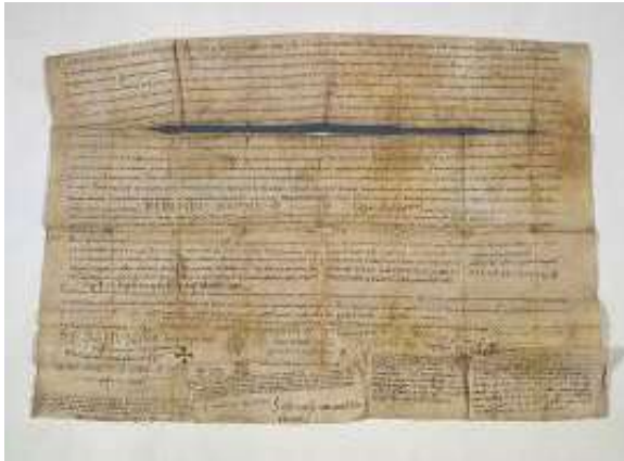
Fotografia de l'anvers de pergamí abans de restaurar (llum difusa)