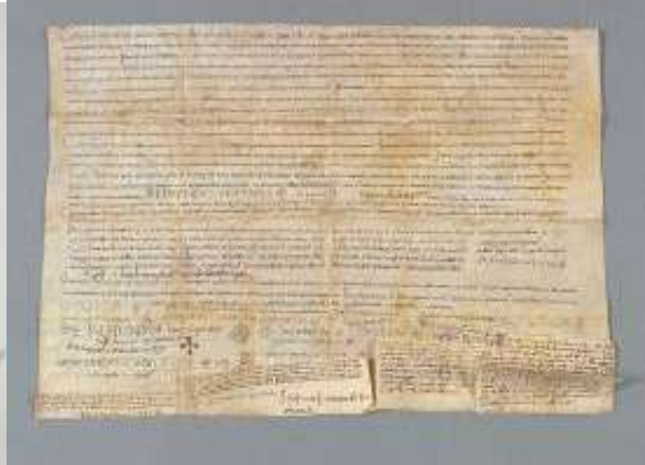
Fotografia de l'anvers del pergamí restaurat (llum difusa)