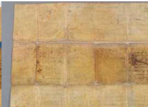
Detall cantonada superior esquerra del revers del pergamí després de retirar la cinta autoadhesiva i consolidar i reintegrar físicament les pèrdues de suport