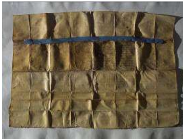
Fotografia del revers del pergamí abans de restaurar (llum rasant)