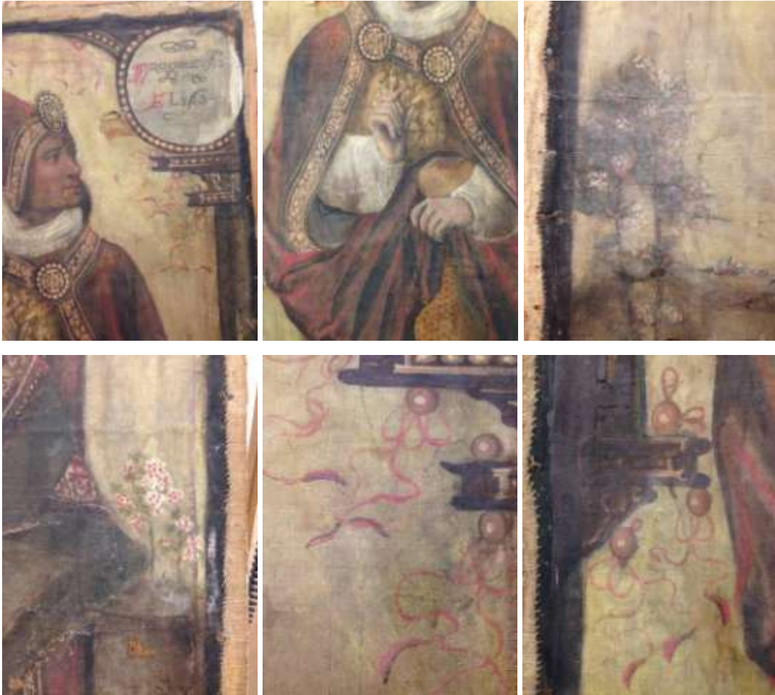
Detalls de la pintura original després de la remoció de la repintada