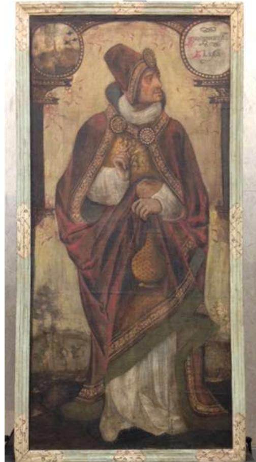
Fotografies d'abans i després de la intervenció