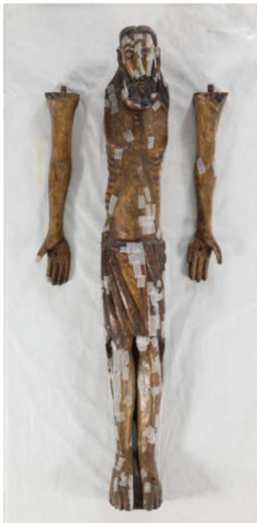
Imatge de l'escultura amb les proteccions de caràcter provisional per evitar desprendiments durant el trasllat

L'obra s'exposarà en el seu emplaçament original, l'absis de l'església parroquial.