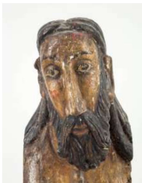
Detall del rostre després de la intervenció