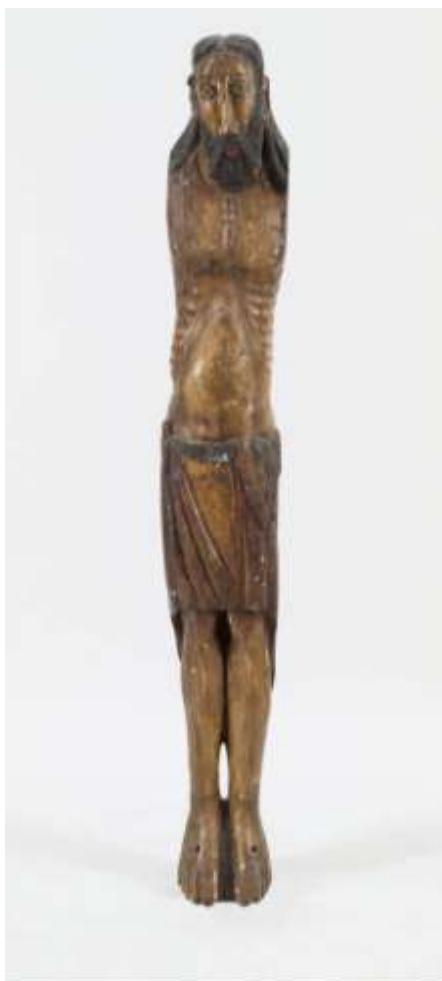
Imatge general de la talla abans de ser restaurada