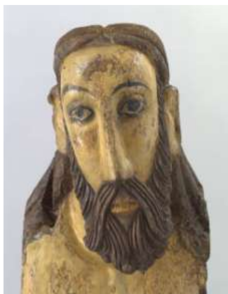
Detall del rostre abans de la intervenció