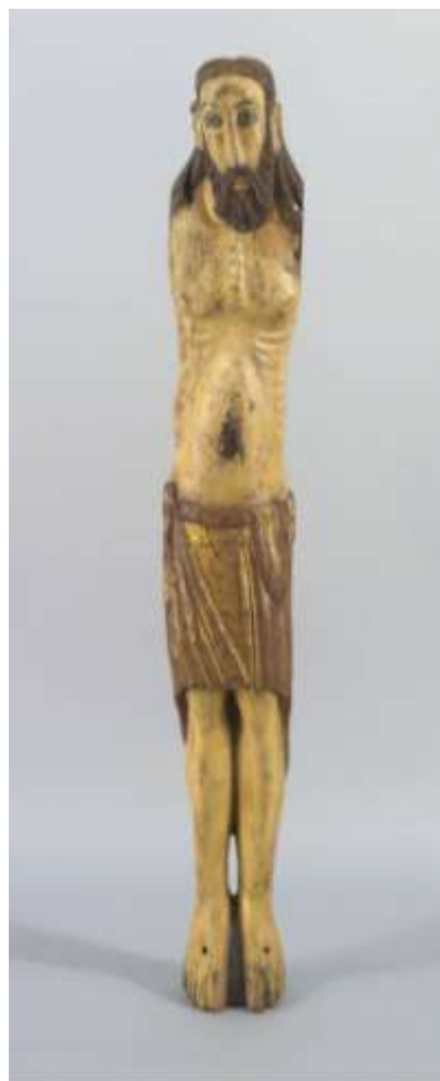
Imatge del tronc de l'escultura una vegada restaurada