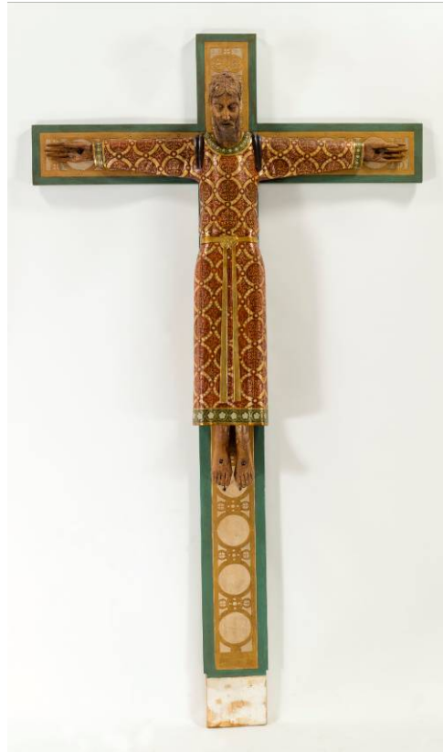
Creu abans i després de restaurar