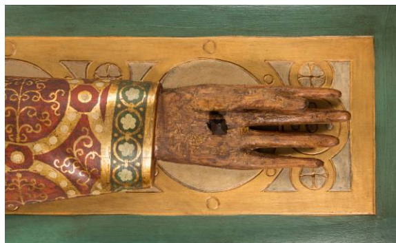
Detall d'una mà abans i després de restaurar