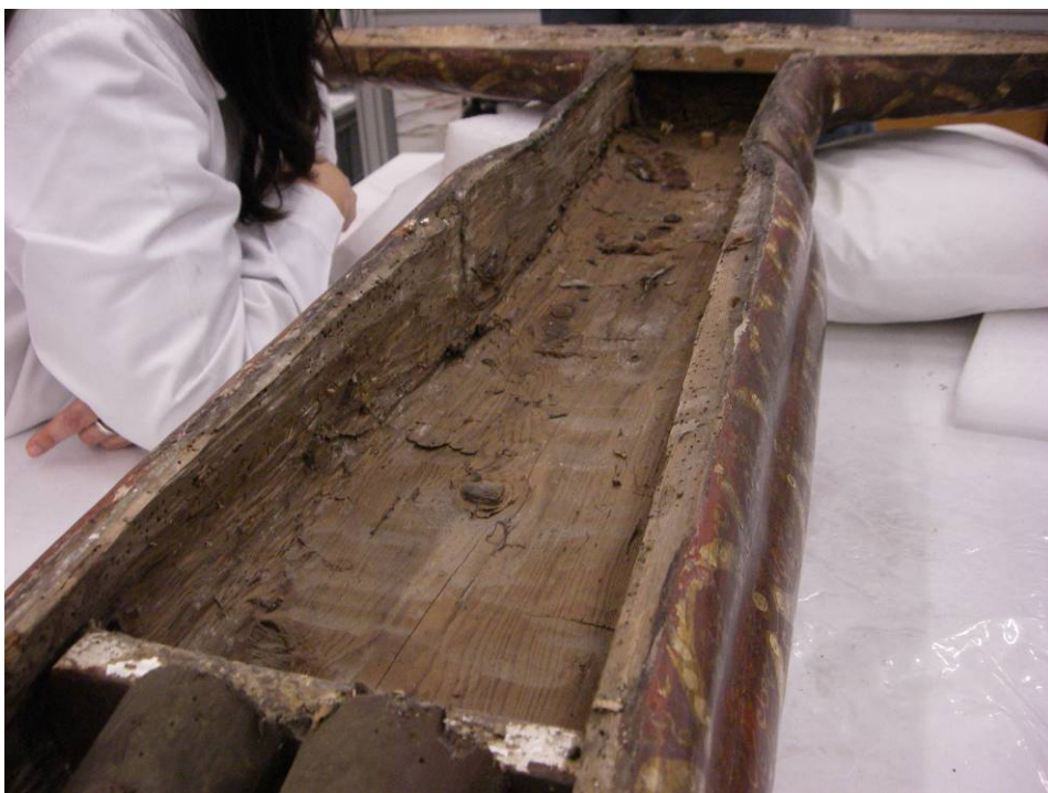
Revers de la túnica. Buidatge de la fusta