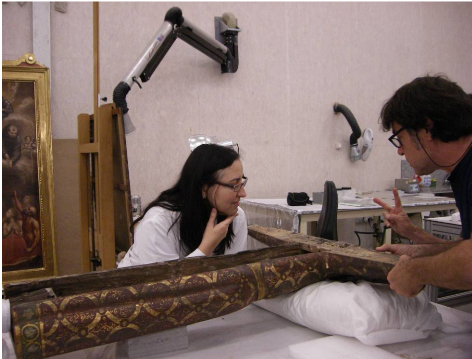
Durant l'examen de la talla