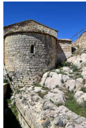
Església de Sant Miquel

La intervenció de conservació i restauració s'ha fet seguint les directrius i protocols del CRBMC. S'ha basat en el criteri de la mínima intervenció, amb la finalitat d'aportar la màxima estabilitat i retornar a l'obra el seu missatge estètic. Amb aquesta actuació es posen a la llum, un cop més, per al gaudi de les nostres generacions i de les futures, elements d'us litúrgic que hem tingut ocults o fora de l'abast i que tornem a posar en valor.