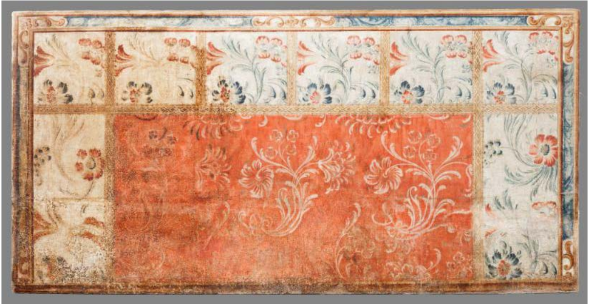
El frontal un cop acabat el procés de conservació i restauració