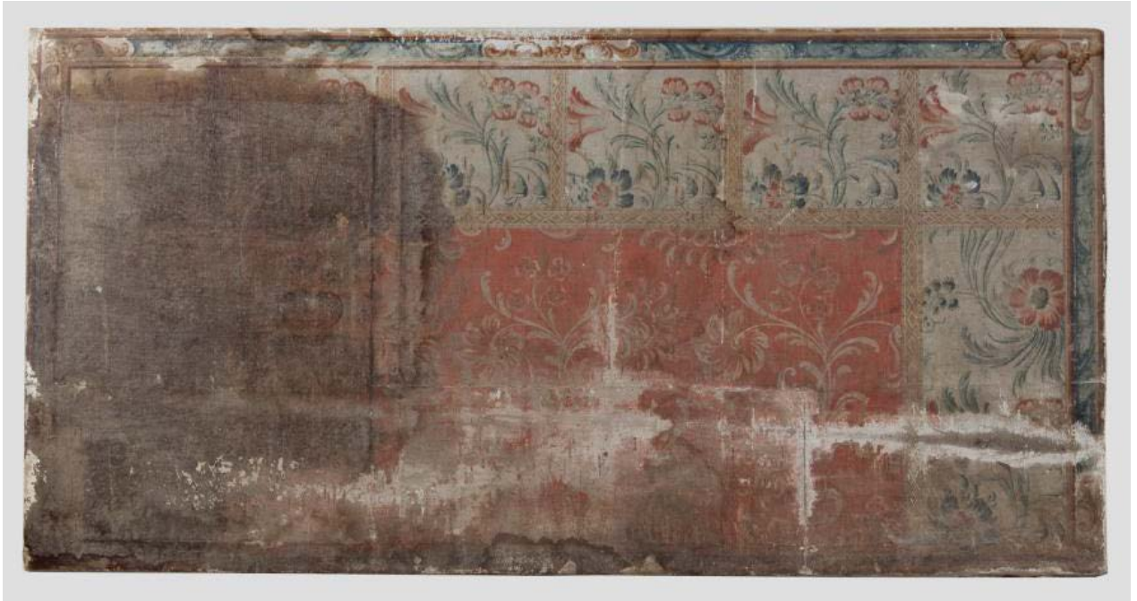
Frontal abans de la intervenció