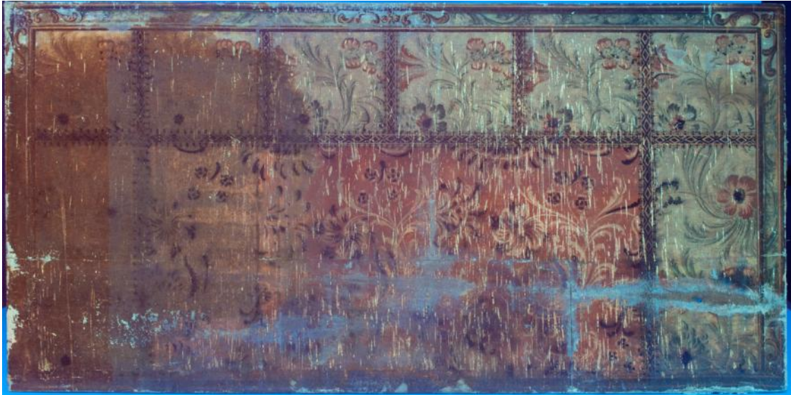
Fotografia amb llum ultraviolada abans de la restauració