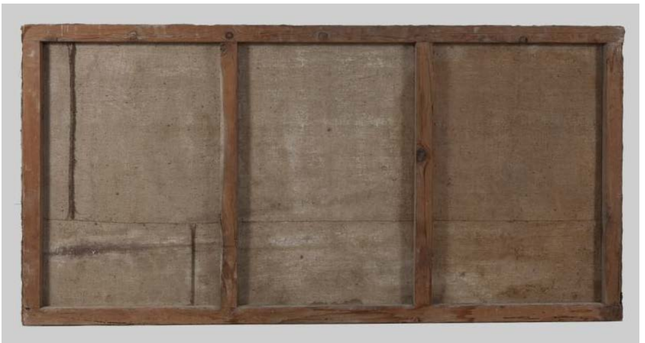
Revers de la tela abans de la restauració