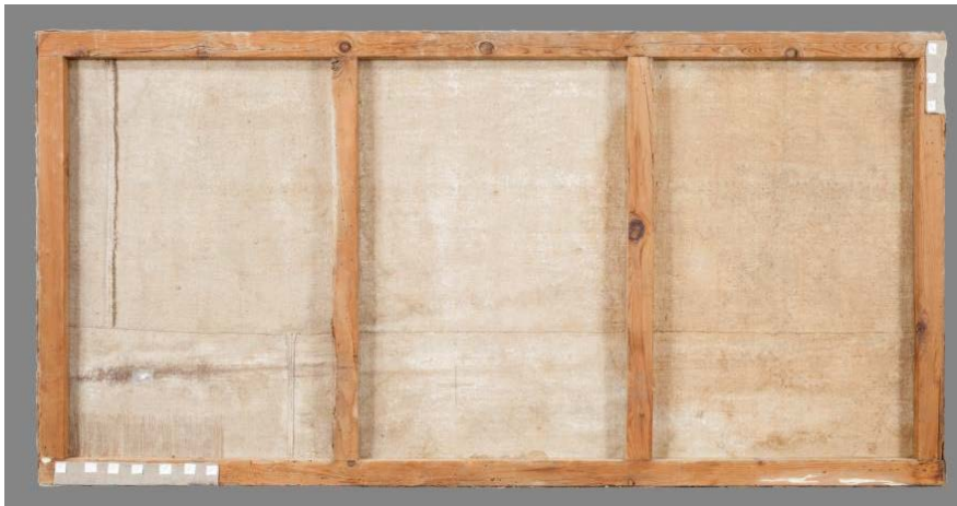
Fotografia final del revers