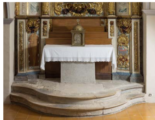
Detall part inferior del retaule