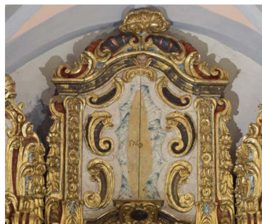
Detall de la data