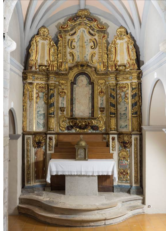
Retaule in situ abans i després del procés de Conservació i Restauració