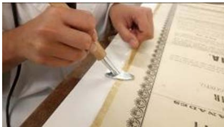
Detall del procés de retirada de la cinta autoadhesiva del cartell-programa de 1868