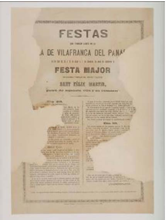
Fotografies del cartell-programa de 1882 per l'anvers abans i després de la intervenció on s'observa la intervenció de reintegració de les grans pèrdues del suport