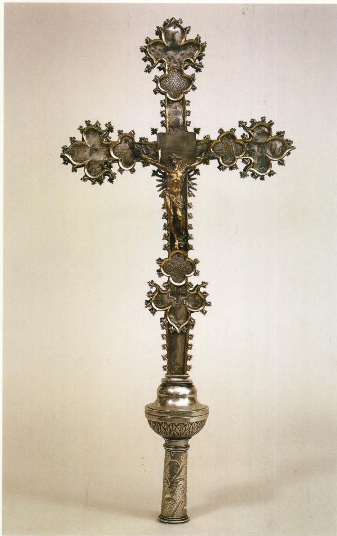
La creu un cop restaurada