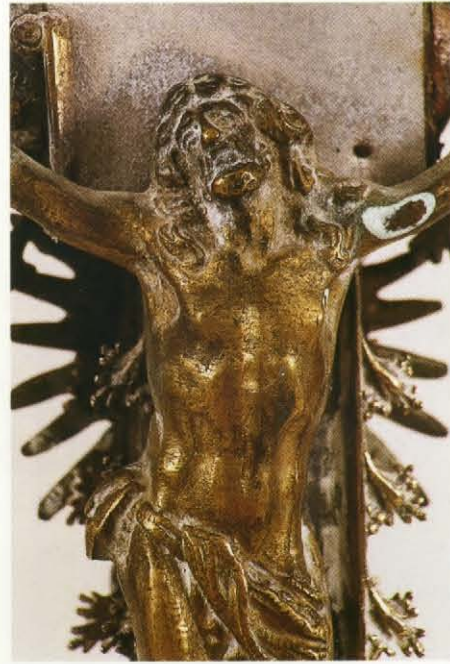
Detall de Crist abans de restaurar

Plata Segle XVI 76,8 × 35,9 × 10 cm Església parroquial de Santa Maria, Ribera de Cardós (Pallars Sobirà) Núm. de reg. de l'SRBM 8842 Any de la restauració: 2002 Coordinació: M. Àngels J. Valls Restauració: Montserrat Cañis